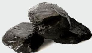
Minério de Xisto