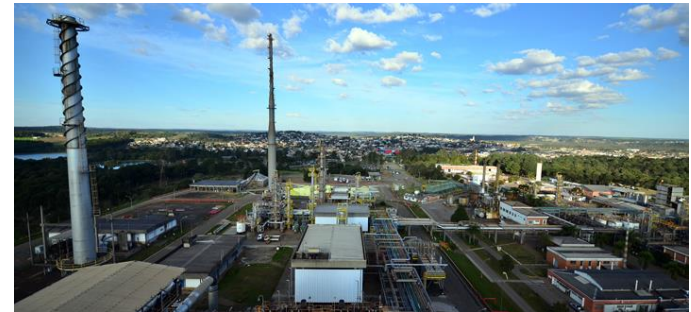
SIX – Unidade de Industrialização do Xisto