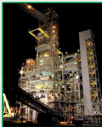
Unidade de Pirólise de Xisto