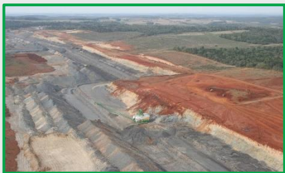
Mina de Xisto