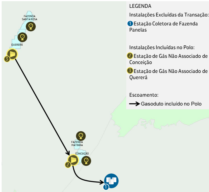
Figura 1 - Diagrama Esquemático do Polo Tucano Sul